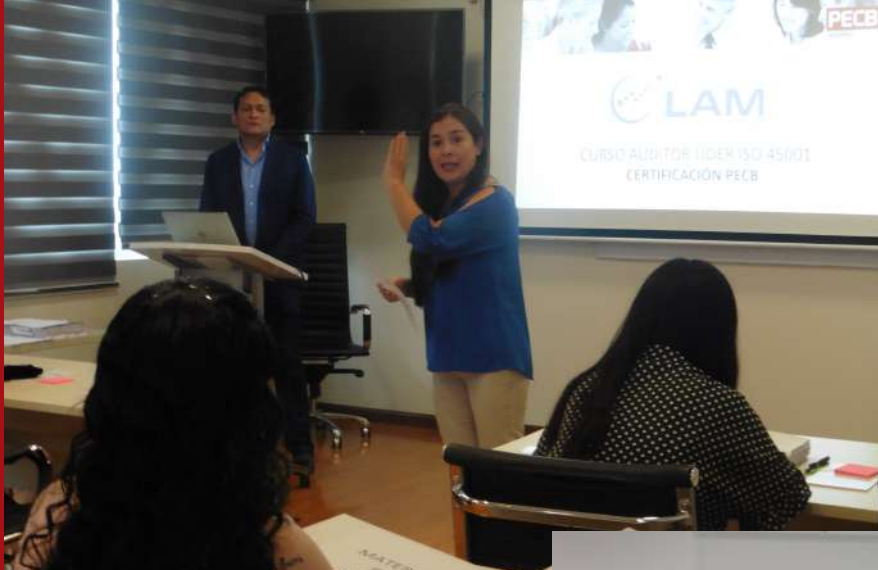
Curso de Auditor Líder ISO 45001 con Certificación PECB-Canadá.