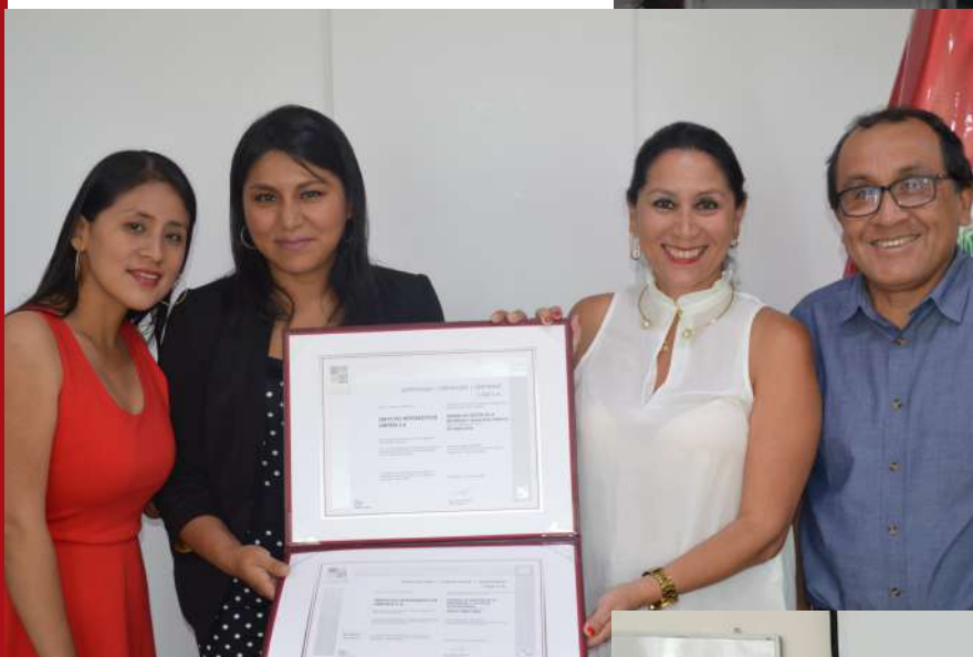
Se logró Certificación en SILSA, gracias a consultoría en ISO 45001:2018.