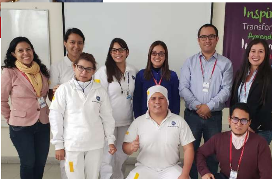
Certificación ISO 45001 en la Compañía Nacional de Chocolates de Perú. Consultoría a cargo de Consultores LAM Group.