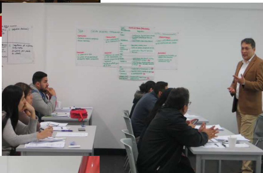
Capacitación en Sistemas Integrados de Gestión ISO 9001, ISO 45001, ISO 14001.